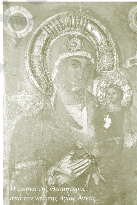
Η εικόνα της Θεομήτορος από τον ναό της Αγίας Άννας