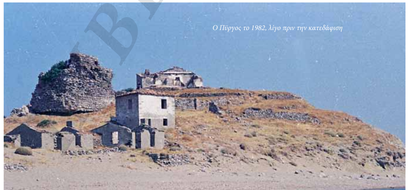
Ο Πύργος το 1982, λίγο πριν την κατεδάφιση