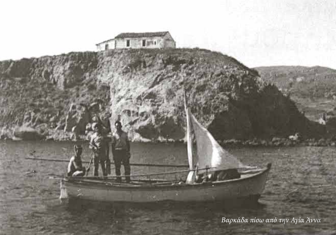
Βαρκάδα πίσω από την Αγία Άννα

Επίσης ο Σεβασμιώτατος Μητροπολίτης Δέρκεων κ. Ιάκωβος (πρώην Ίμβρου), οι βουλευταί Δαρδανελίων και τόσοι εξ Ισταμπούλ όσον και από άλλα μέρη του εσωτερικού και εξωτερικού διάφοροι φίλοι και γνωστοί των νησιωτών μας, συμμερίστηκαν το πένθος. Το νησί τούς ευχαριστεί μέσω των μορφωτικών Συλλόγων του και της «Ίμβρου».