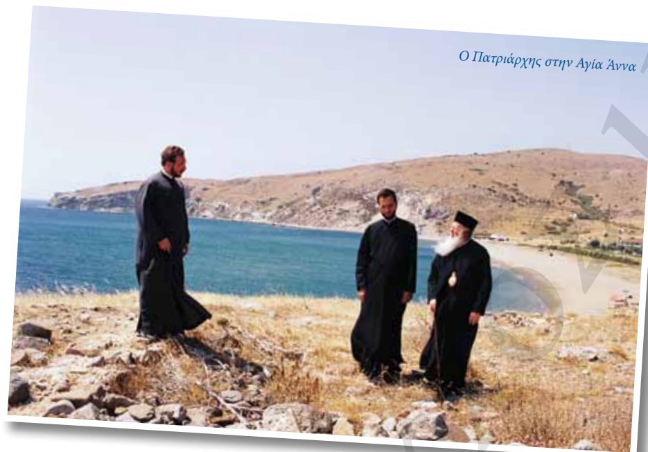
Ο Πατριάρχης στην Αγία Άννα