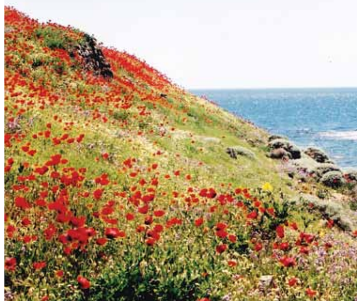
Ο λόφος της Αγίας Άννας την Άνοιξη

Μετά απ' όλο αυτό το κακό, όλοι μας περάσαμε δύσκολες μέρες και κυρίως η μάνα μας. Χήρα με τρία παιδιά, είχε ν' αντιμετωπίσει και τις πολλές ανακρίσεις από τις αρχές του Πύργου. Μεγάλη στενοχώρια και πόνος όλα αυτά. Δεν θα ξεχάσουμε ποτέ. Προσευχόμαστε πάντα ο Θεός να δίνει ανάπαυση στις ψυχές όλων εκείνων των αδικοχαμένων. Άλλη παρηγοριά δεν έχουμε».