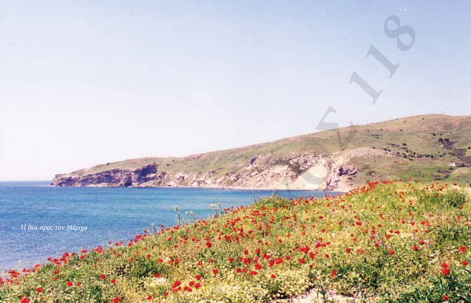
Η θέα προς τον Μέρια

μπορούσαμε να συνεννοηθούμε. Είχαμε φτάσει στο ύψος του Σκυλόγκρεμνου. Σιγά-σιγά η βάρκα όλο και βάραινε και όσο κουπί κι αν έκαναν δεν προχωρούσε. Εγώ, καταλαβαίνοντας τον κίνδυνο, μετακινήθηκα στο πίσω μέρος της βάρκας και παρόλη την αγωνία μου, άρχισα να ανησυχώ τι θα πω στον αδερφό μου όταν βγω έξω αφού δεν τον είχα ενημερώσει. Σταδιακά είχε αρχίσει η γκρίνια και ο τσακωμός, ο οποίος εξελίχθηκε σε πανικό ειδικά από όσους δεν γνώριζαν κολύμπι. Μέσα στον πανικό κάποιοι άρχισαν να πέφτουν στη θάλασσα. Τότε κι εγώ πήρα μια βαθιά ανάσα και βούτηξα όσο πιο μακριά μπορούσα.