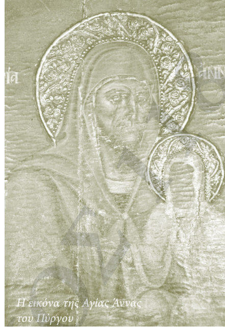
Η εικόνα της Αγίας Άννας του Πύργου

Η εικόνα της Αγίας Άννας τοποθετήθηκε στο νάρθηκα της Κοίμησης του Σχοινουδίου αριστερά της εισόδου του ναού, ενώ η Θεομήτωρ κόρη της δεξιά. Στο μεταξύ ο ναός στον Πύργο ερειπωνόταν σιγά-σιγά, ώσπου μια μέρα στις αρχές της δεκαετίας του '80 κατεδαφίστηκε μαζί με τις υπόλοιπες οικοδομές του οικισμού. Όμως οι Σχοινουδιώτες πάντα επικαλούνται τη χάρη Της και τη «λειτουργούνε» στην Κοίμηση του Χάλακα στο Σχοινούδι όπου βρίσκεται η αγία εικόνα Της.