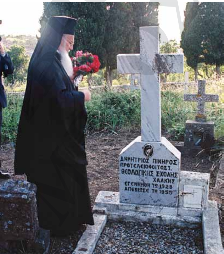
Ο Πατριάρχης στον τάφο του Δημ. Πινήρου, στο Σχοινούδι

Δεν πρόφτασα να τελειώσω τη φράση μου και ένοιωσα ένα δυνατό τράνταγμα που κάρφωσε τη βάρκα στο μέρος της. Όλοι κλονιστήκαμε και κινδυνέψαμε να πέσουμε στο νερό. Την ίδια στιγμή είδα τον καπετάνιο να ορμά μπροστά και ύστερα να μου φωνάζει «τα κουπιά... τα κουπιά...». Δεν μπορούσα να κουνηθώ από τη θέση μου, ο πανικός είχε αρχίσει. Το νερό μούγκριζε καθώς ορμούσε μέσα στην ανοιγμένη τρύπα, είχαμε χτυπήσει σε βράχο. Κλάματα μικρών παιδιών και γυναικεία ξεφωνητά ξέσχισαν τον αγέρα. Λίγα δευτερόλεπτα μεσολάβησαν κι ύστερα γείραμε από τη μια πλευρά και βρεθήκαμε όλοι αναπάντεχα μες στο γαλάζιο νερό. Δεν ήξεραν κολύμπι φαίνεται οι περισσότεροι κι αρχίσαν να πιάνουν ο ένας τον άλλο, να παλεύουν και ύστερα να βουλιάζουν μ' ανοιχτά τα στόματα από τις φωνές. Η σκέψη μου είχε σταματήσει, τα μάτια μου έβλεπαν θολά και το κορμί μου βούλιαζε σαν ένας όγκος από σκέτο μολύβι, καθώς το πίεζαν πολλά γυναικεία χέρια. Ήταν αδύνατο ν' ανέβω επάνω και έτσι δεν έκανα καμία προσπάθεια γι' αυτό. Κράτησα όσο μπορούσα την αναπνοή μου και ένιωσα να