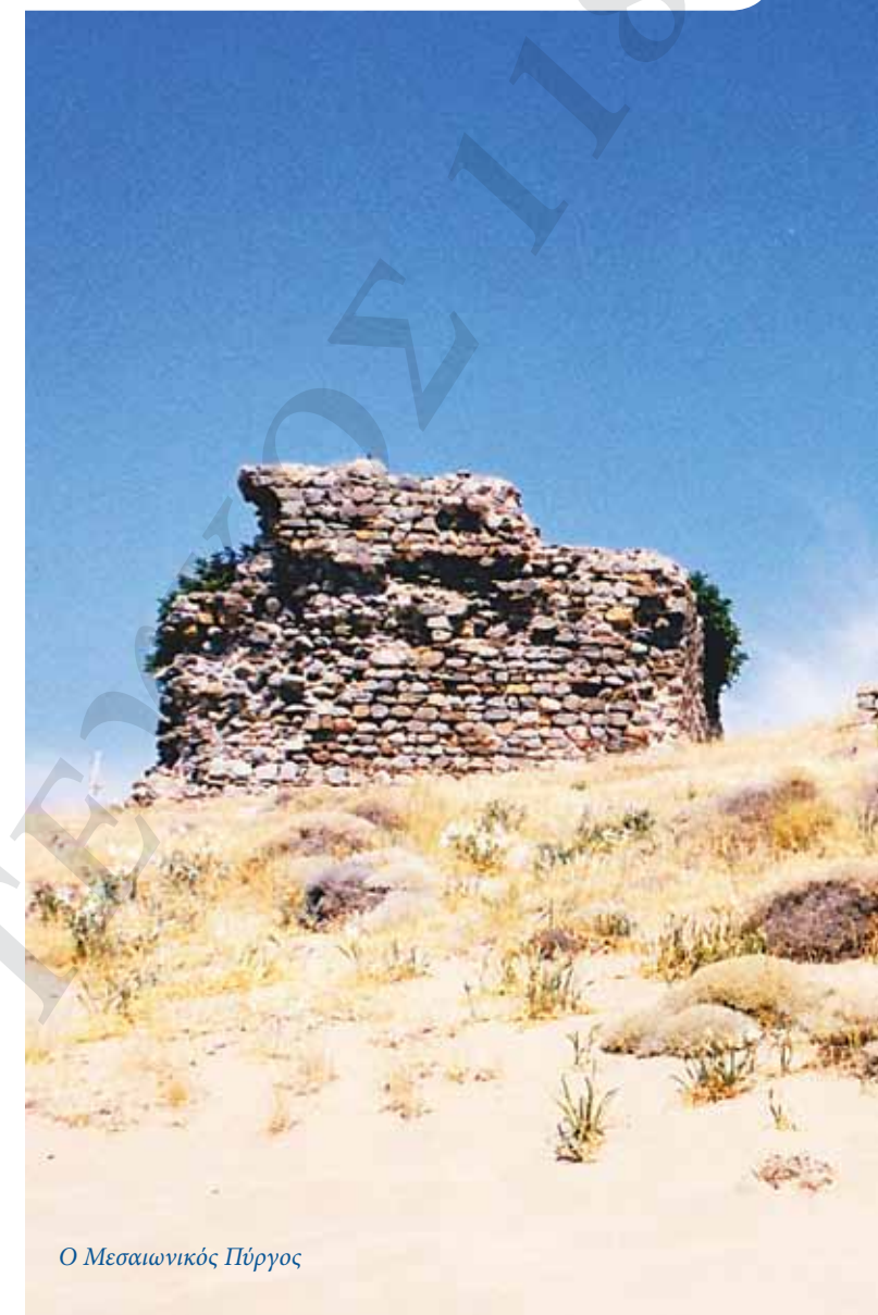
Ο Μεσαιωνικός Πύργος

είχε μια βάρκα στον Πύργο και μ' αυτήν έβγαινε για ψάρεμα όλα τα χρόνια της ζωής του, όταν το επέτρεπε ο καιρός και οι αγροτικές δουλειές με τις οποίες ζούσε την οικογένειά του.