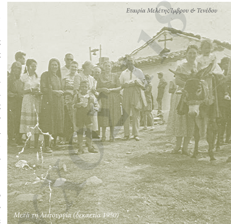
Μετά τη λειτουργία (δεκαετία 1950)