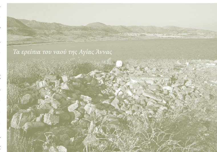
Τα ερείπια του ναού της Αγίας Άννας