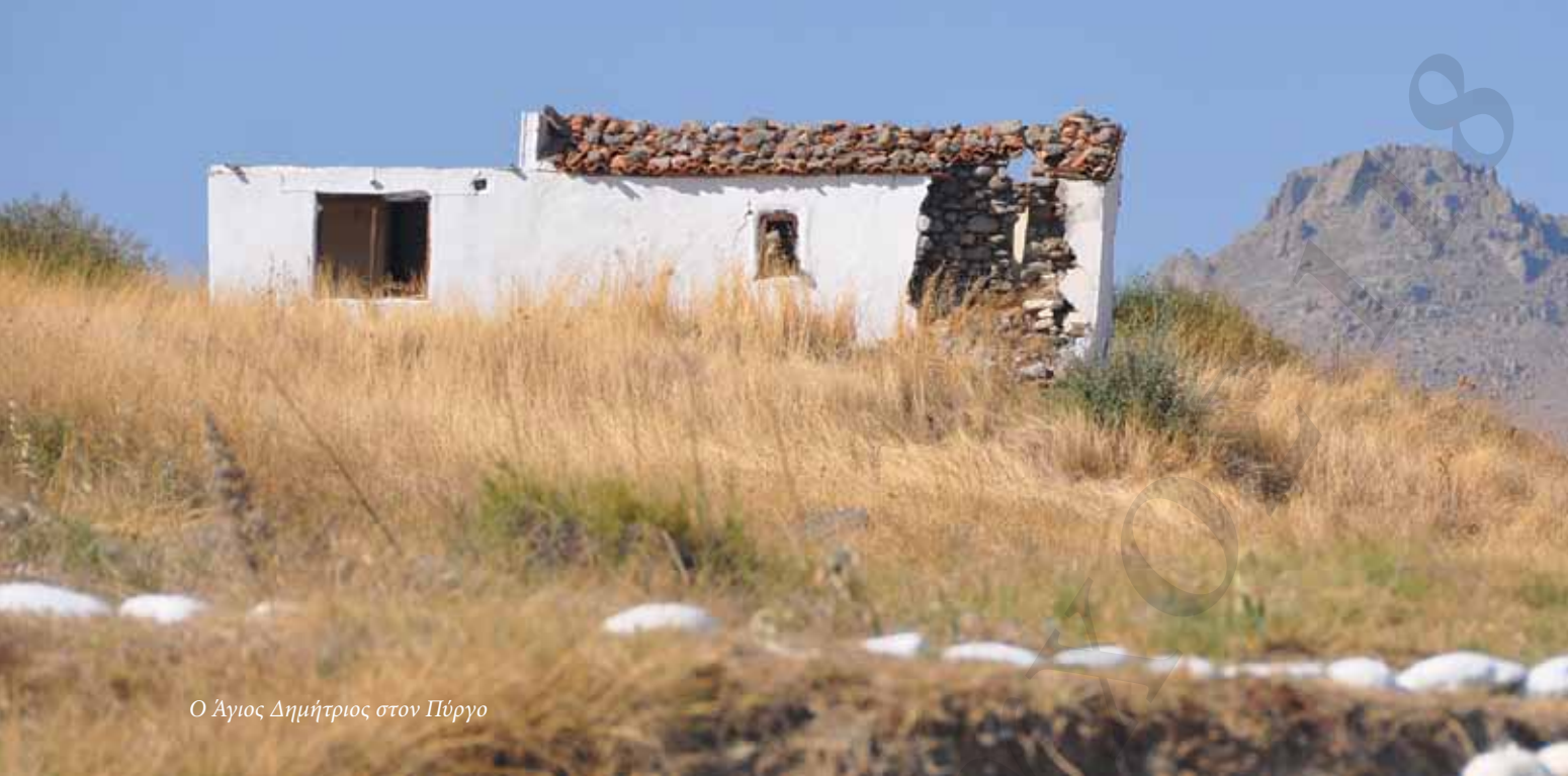
Ο Άγιος Δημήτριος στον Πύργο